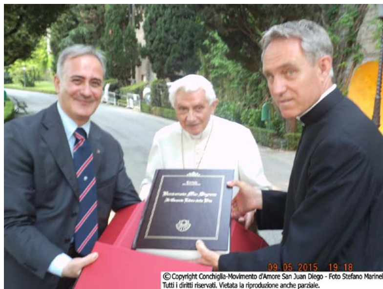
Città del Vaticano - 09 maggio 2015 - Giardini Vaticani Sua Santità Papa Em. Benedetto XVI e S.E.R. Mons + Georg Gänswein

Svelato il nome dell'Elia sigillato... nel cuore di Conchiglia: Sua Santità Papa Em. Benedetto XVI