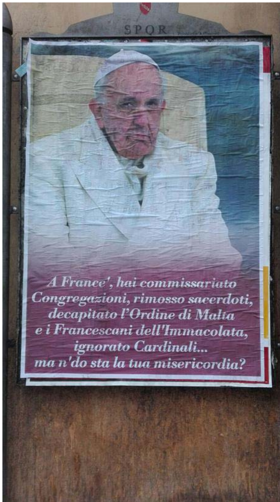
Il manifesto

Maria Santissima, Nostra Signora di Guadalupe Trasposizione della Tilma sul Planisfero di Brown che assume la forma di una conchiglia .