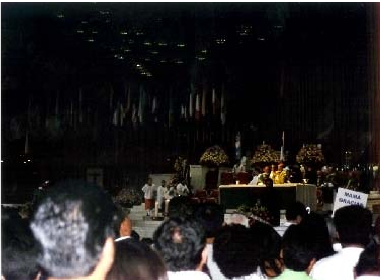
El Cardenal durante la elevación del Caliz con la Sangre de Jesús