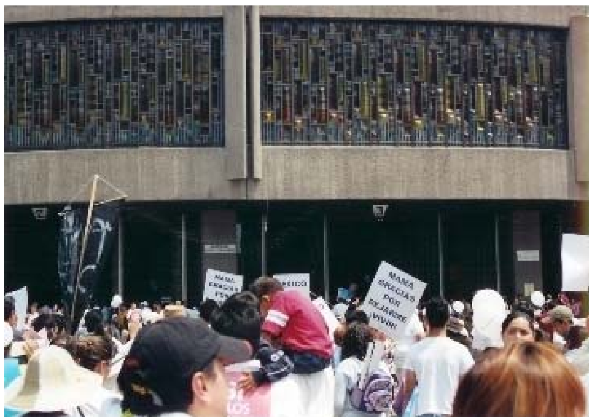
Los participantes a la marcha contra el aborto llegan a la Basílica de Guadalupe.