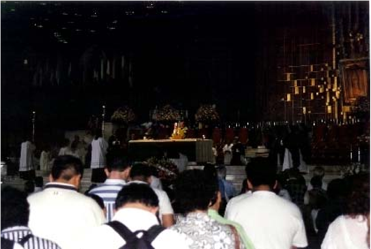
El Cardenal durante la elevación de la Santa Eucaristia.