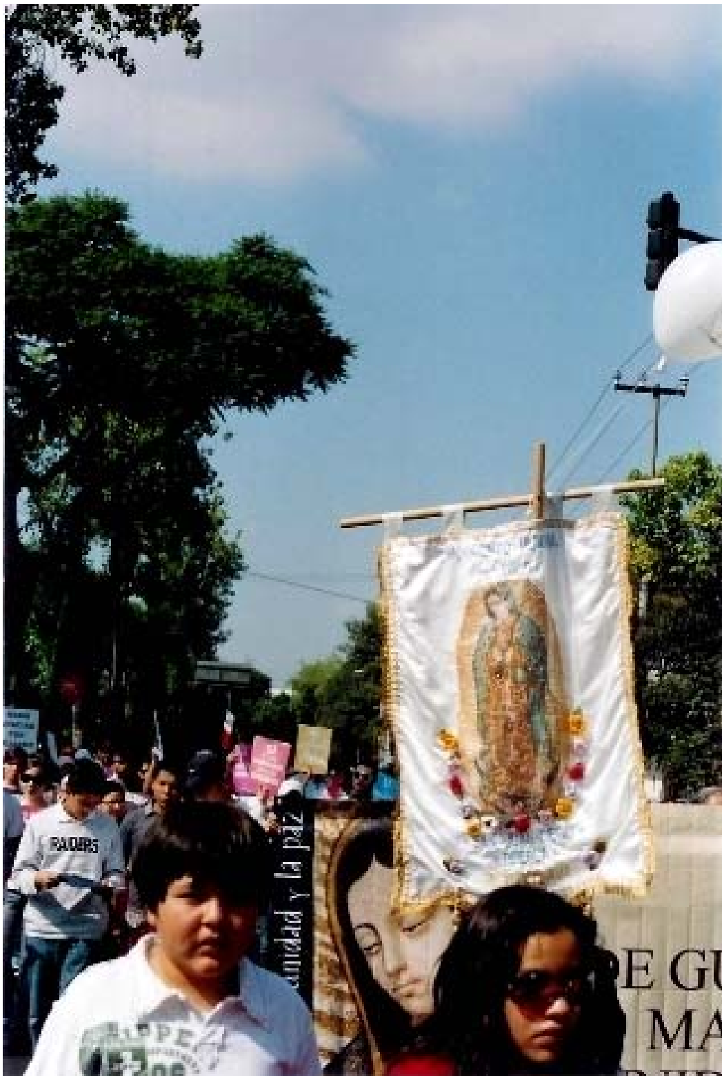
Imágenes de la Marcha realizada en Ciudad de México D.F., el día 22 de junio de 2008, que partió de Peralvillo para llegar a la Basílica de NUESTRA SEÑORA DE GUADALUPE. El Movimiento de Amor San Juan Diego llevó dos autobuses en combinación con la UPAEP.