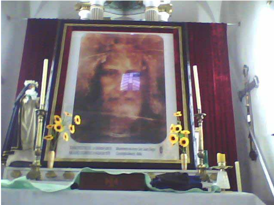
La Santa Faz, el Divino Rostro de Jesus sobre el Altar Major - 2.72 m x 2.33 entronizado por el Movimiento d'Amore San Juan Diego en la Iglesia de Xanenetla, Puebla – México