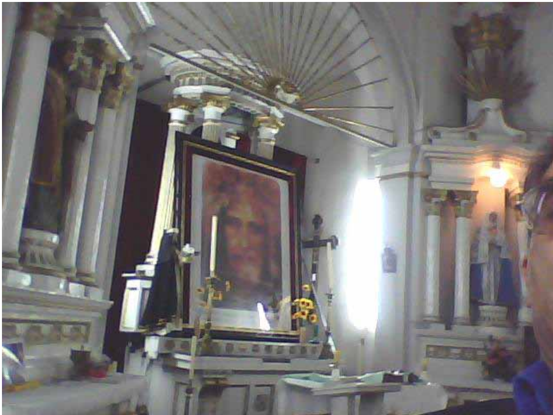
La Santa Faz, el Divino Rostro de Jesus sobre el Altar Major - 2.72 m x 2.33 entronizado por el Movimiento d'Amore San Juan Diego en la Iglesia de Xanenetla, Puebla – México