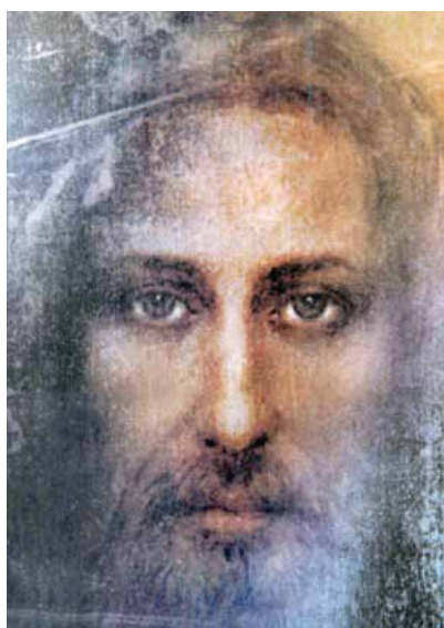
EL DIVINO ROSTRO DE JESUS