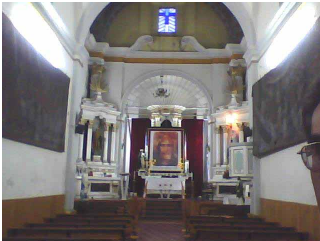
La Santa Faz, el Divino Rostro de Jesus sobre el Altar Mayor - 2.72 m x 2.33 entronizado por el Movimiento d'Amore San Juan Diego en la Iglesia de Xanenetla, Puebla – México