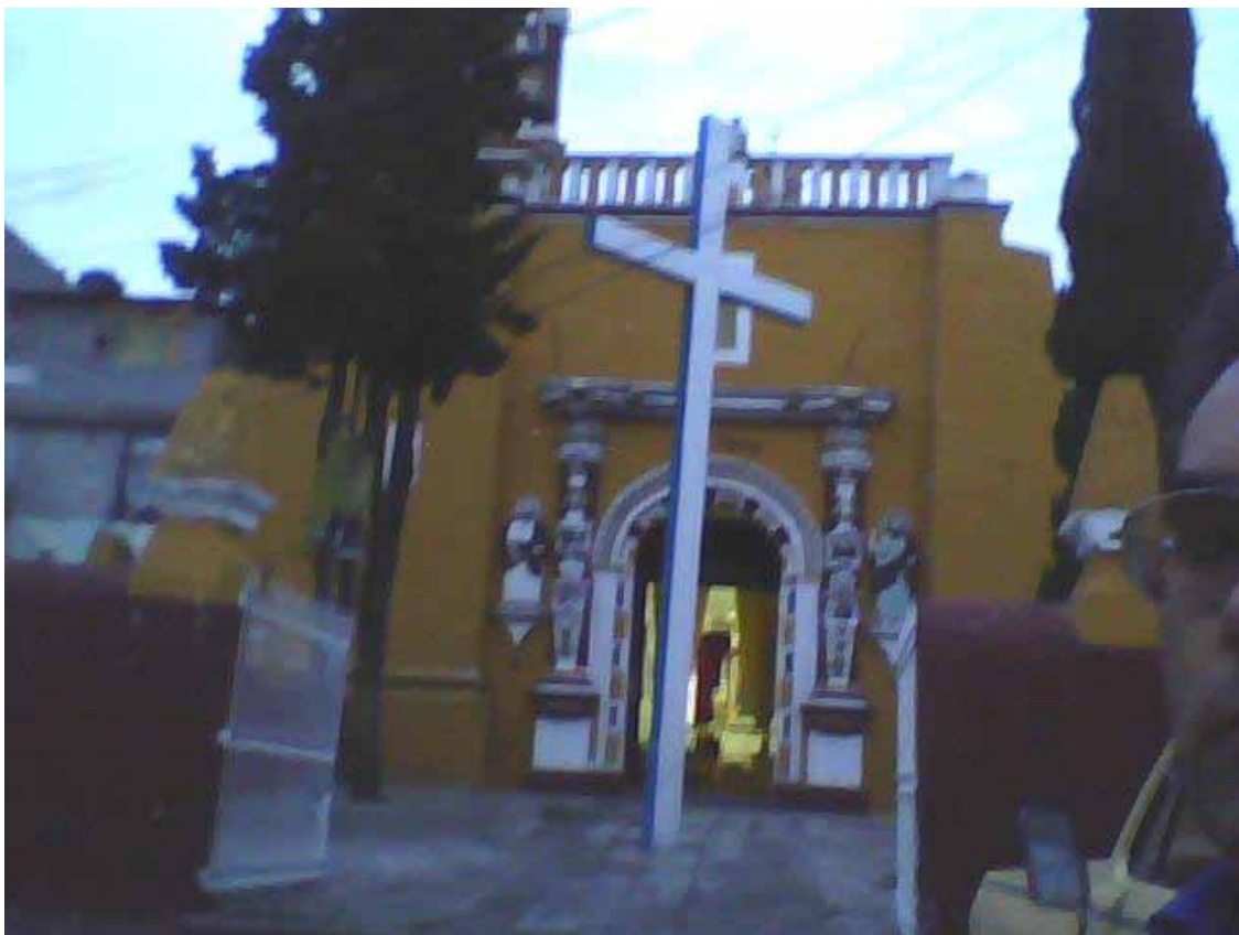
Sul sagrato della Chiesa La Croce d'Amore di Dozulé di 7.38 x 1.23 m elevata di fronte alla Chiesa di Xanenetla, Puebla, México.

IL SANTO VOLTO DI GESÙ è impresso nel cuore di ognuno di voi.