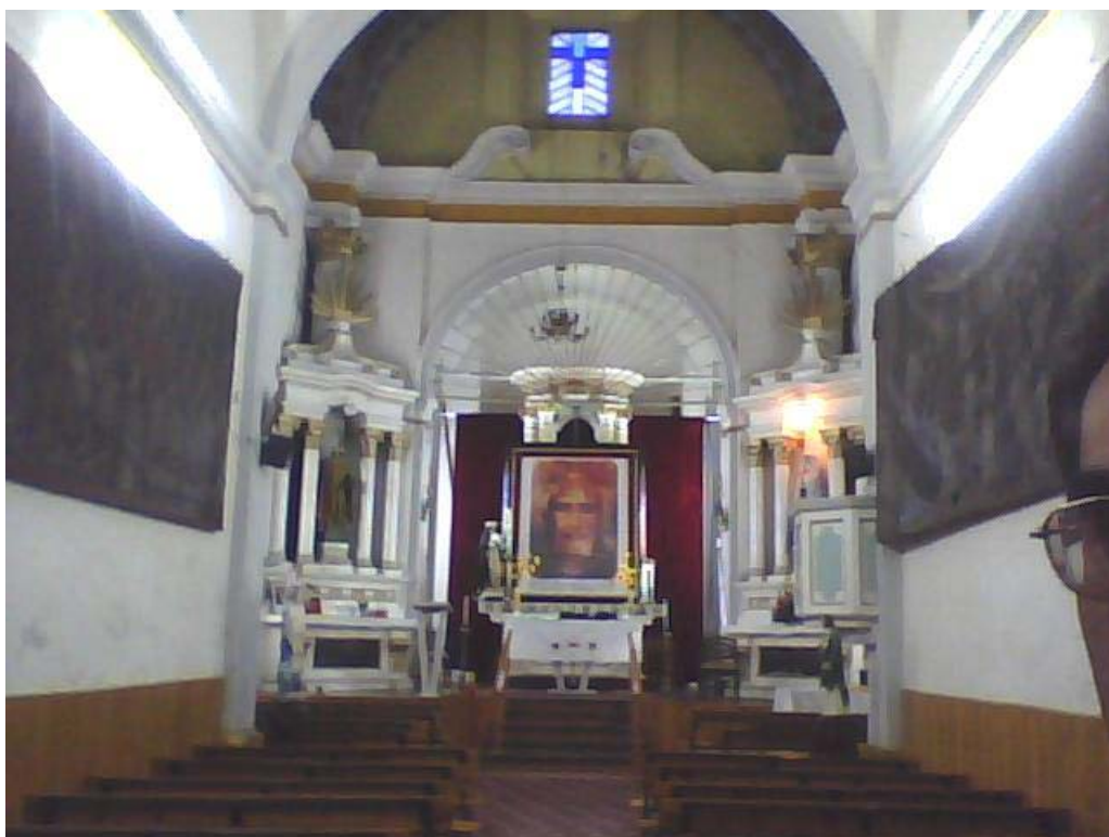
Chiesa di Xanenetla - Puebla - México