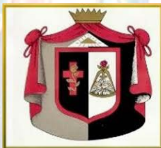
Emblema araldico del 18° grado

(Martin Lutero, Weim., X, P. II, 107, 8-11)