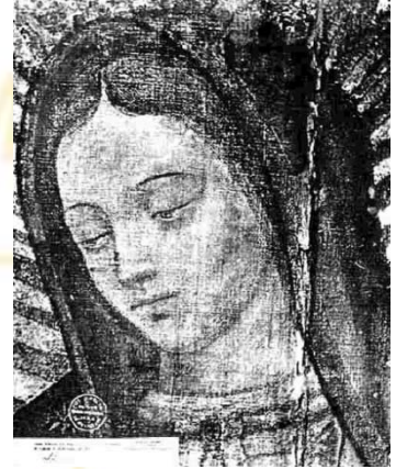
Maria Santissima, Nostra Signora di Guadalupe