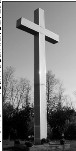
La "Croce d'Amore" eretta alle porte di Staffòli

«... Dio non vi chiede mai l'impossibile e in tutto ciò che farete per Me, troverete la ricompensa nell'atto stesso che compirete per la Mia Gloria. Io sono con voi in tutto ciò che farete affinché regni la Mia Santa Croce sul Mondo intero, perché è con la Mia Santa Croce che annuncio la Mia Venuta nella Gloria. Noi vinceremo con la Mia Croce. Essa deve essere come l'eco che si ripete all'infinito, rimbalzando di monte in monte. Migliaia di voci, migliaia di Croci che stanno per innalzarsi sul mondo intero: la Croce fa fuggire il Male. Sì, avete capito giusto: è per mostrare ai popoli che devono vivere all'ombra della Mia Croce; per questo motivo esse devono essere luminose; saranno numerose come le Stelle della terra, accese grazie all'onomo che ha obbedito alla Volontà di