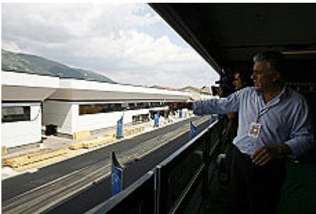
Le nuove palazzine allestite per ospitare le delegazioni all'Aquila

Da oggi gli edifici diventano "zona rossa": nessuno si potrà avvicinare senza pass Mobilitati i militari: 15mila uomini impegnati. E dai cieli vigilerà un Predator dal nostro inviato JENNER MELETTI