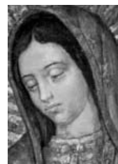
Vero Volto di Maria

La Donna vestita di Sole dell'Apocalisse