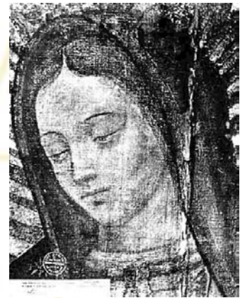
Najświętsza Maryja Panna, Nasza Pani z Guadalupe