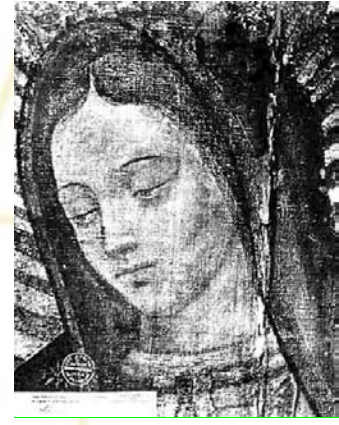
Najświętsza Maryja Panna, Nasza Pani z Guadalupe