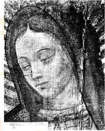
Najświętsza Maryja Panna, Nasza Pani z Guadalupe