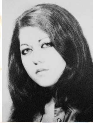
Conchiglia w wieku 18 lat