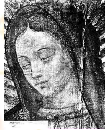
Najświętsza Maryja Panna, Nasza Pani z Guadalupe