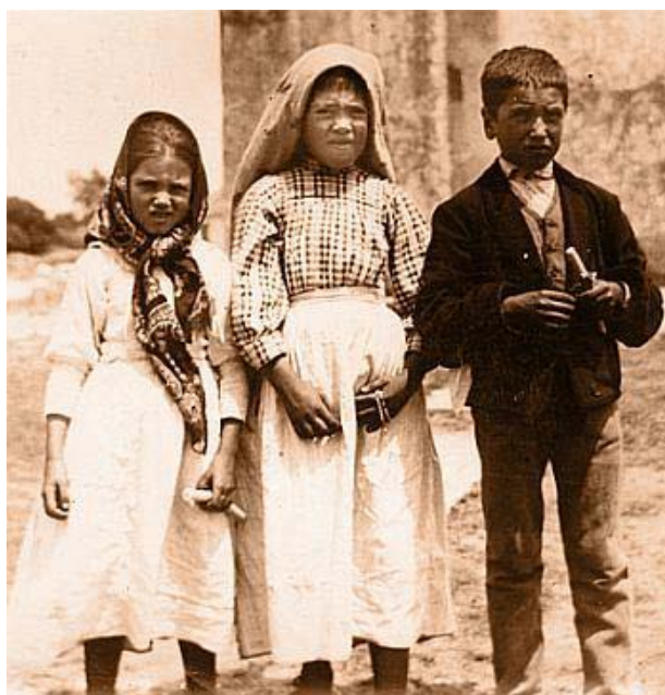
Hiacynta, pośrodku prawdziwa Siostra Łucja i Franciszek

W tej Światowej Manifestacji na cześć Najświętszej Maryi Panny z okazji SETNEJ ROCZNICY Objawień w Fatimie: 1917 - 2017 może uczestniczyć każdy, bez różnicy... z każdego miejsca na Świecie.