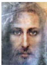
Prawdziwe Oblicze Jezusa Chrystusa, Króla Wszechświata