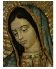
Verdadeira Face de Maria Santíssima N.S. de Guadalupe e Rainha do Universo

Em obediência só no ensinamento de Jesus, Filho de Deus Ele Mesmo Deus no Santo Evangelho.