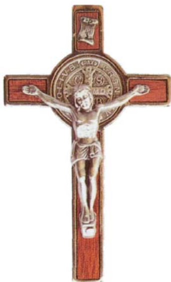
CROCIFISSO DI SAN BENEDETTO

verrà concessa a tutti coloro che porteranno devotamente la medaglia di San Benedetto, detto anche il Crocifisso della Buona Morte.