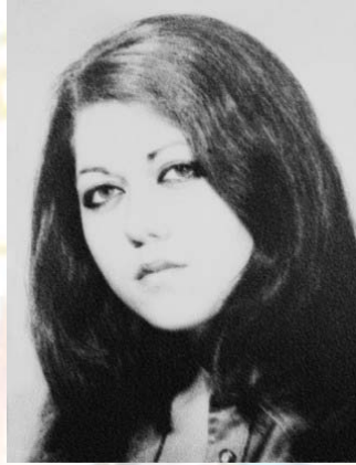
Конкильях в возрасте 18 лет