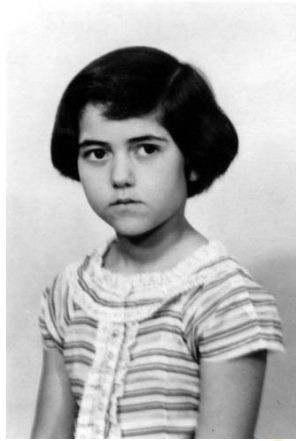
Конкильях в возрасте 8 лет