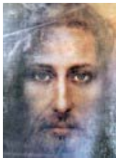
Vero Volto di Gesù Cristo Figlio di Dio, Lui Stesso Dio Re dell'Universo