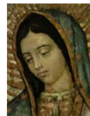
Vero Volto di Maria Santissima Nostra Signora di Guadalupe Regina dell'Universo

Movimento Mondiale fondato da Conchiglia per Volere di Dio il 24 ottobre 2001 dedicato a Maria Santissima Nostra Signora di Guadalupe, La Perfetta, La Donna vestita di Sole dell'Apocalisse - Messico. Movimento a difesa della Chiesa Cattolica di Gesù Cristo con a capo il PAPA. In obbedienza solo nell'insegnamento di Gesù, Figlio di Dio Lui Stesso Dio nel Santo Vangelo.