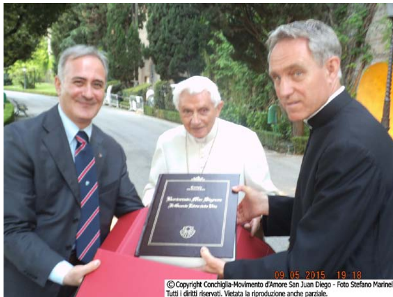
Città del Vaticano - 09 maggio 2015 - Giardini Vaticani Sua Santità Papa Em. Benedetto XVI e S.E.R. Mons + Georg Gänswein

Bentornato Mio Signore « Il Grande Libro della Vita » Nuovo Testamento del Terzo Millennio