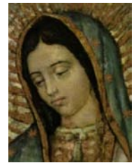
Vero Volto di Maria Santissima Nostra Signora di Guadalupe Regina dell'Universo

Movimento Mondiale fondato da Conchiglia per Volere di Dio il 24 ottobre 2001 dedicato a Maria Santissima Nostra Signora di Guadalupe, La Perfetta, La Donna vestita di Sole dell'Apocalisse - Messico. Movimento a difesa della Chiesa Cattolica di Gesù Cristo con a capo il PAPA. In obbedienza solo nell'insegnamento di Gesù, Figlio di Dio Lui Stesso Dio nel Santo Vangelo.