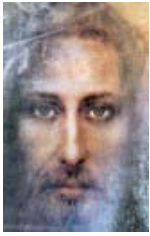
Verdadero Rostro de Jesucristo Rey del Universo