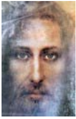
Verdadero Rostro de Jesucristo Rey del Universo