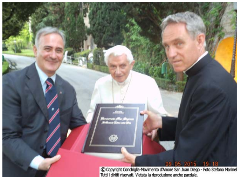
Ciudad del Vaticano - 09 de mayo de 2015 - Jardines Vaticanos Su Santidad Papa Em. Benedicto XVI y S.E.R. Mons + Georg Gänswein

Bienvenido Mi Señor « El Gran Libro de la Vida » Nuevo Testamento del Tercer Milenio